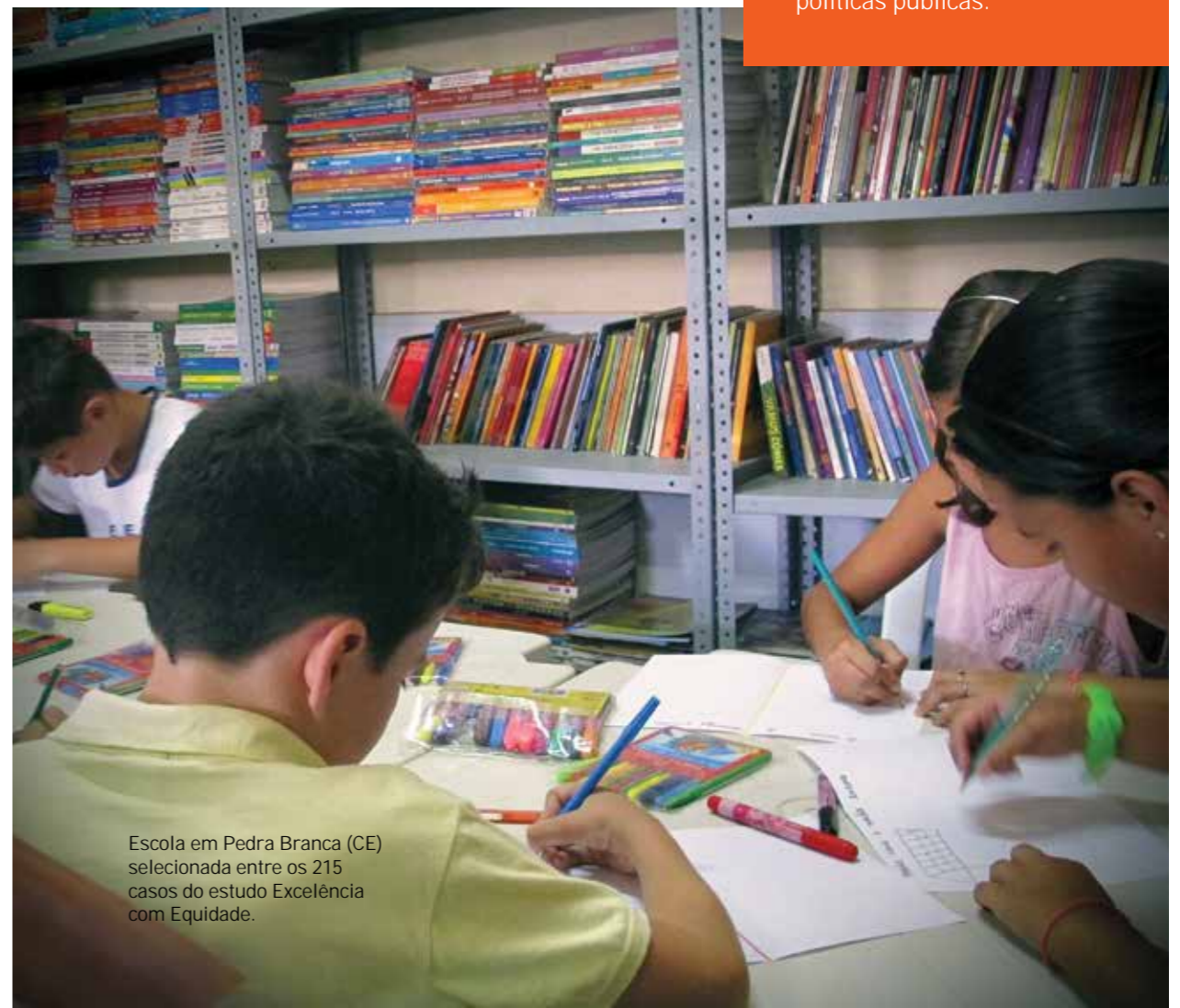
Escola em Pedra Branca (CE) selecionada entre os 215 casos do estudo Excelência com Equidade.

A segunda edição do seminário realizado em parceria com o Inspirare e o Instituto Península – já reconhecido como uma referência na agenda da educação – apresentou experiências concretas de inovações educacionais, nacionais e internacionais, da sala de aula às políticas públicas.